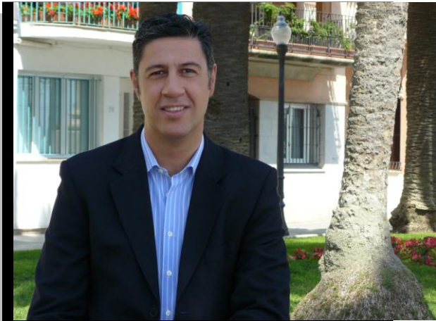
Xavier Garcia Albiol Candidato a la Alcaldía de Barcelona